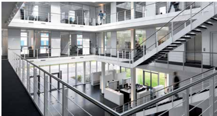
Légère et transparente : la nouvelle construction de DIAL à Lüdenscheid

Pour DIAL, il était clair que la gestion technique du bâtiment, la domotique et l'éclairage seraient centralisés. L'institut accordait une valeur particulière à l'étroite interaction entre planification de l'éclairage, l'architecture et le design de lampes. DIAL a accompagné le projet de manière compétente de la conception à la finalisation. Sur trois étages couvrant une surface utile totale de 2 000 m 2 ,