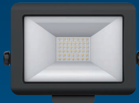
theLeda B30L BK